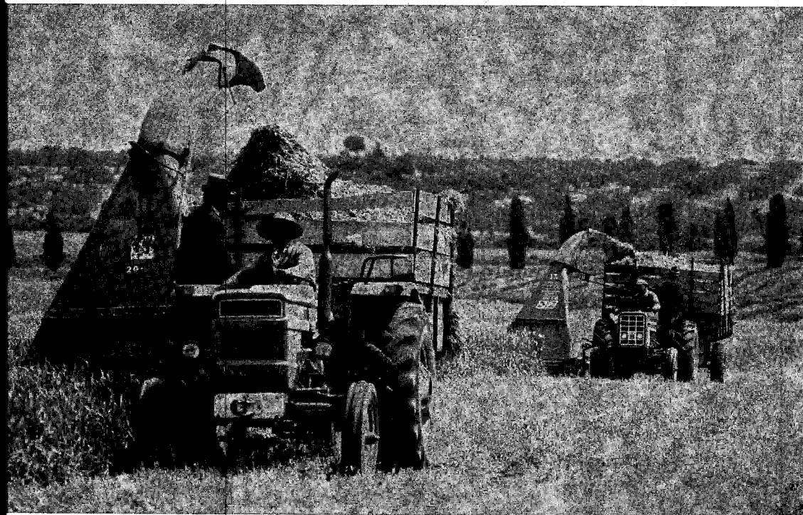
Photo n° 1. — Ensileuses à fléaux semi-portées dans la parcelle d'orge — pois d'un adhérent du projet.

Pour réussir, l'engraissement doit être effectué avec des animaux répartis en lots homogènes et