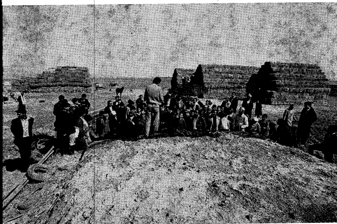
Photo n° 3. — Journée d'information sur l'utilisation de l'ensilage dans l'exploitation d'un adhérent.

i) Production fourragère : ils se rapportent à la production fourragère proprement dite (choix des espèces, façons culturales), à l'équipement (silos, remorques, ensileuses), à l'opération de