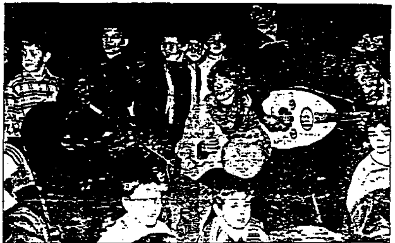
Jouer au milieu des enfants, rien de tel pour capter leur attention !

Et du travail en groupe, il en a été question toute la jour-