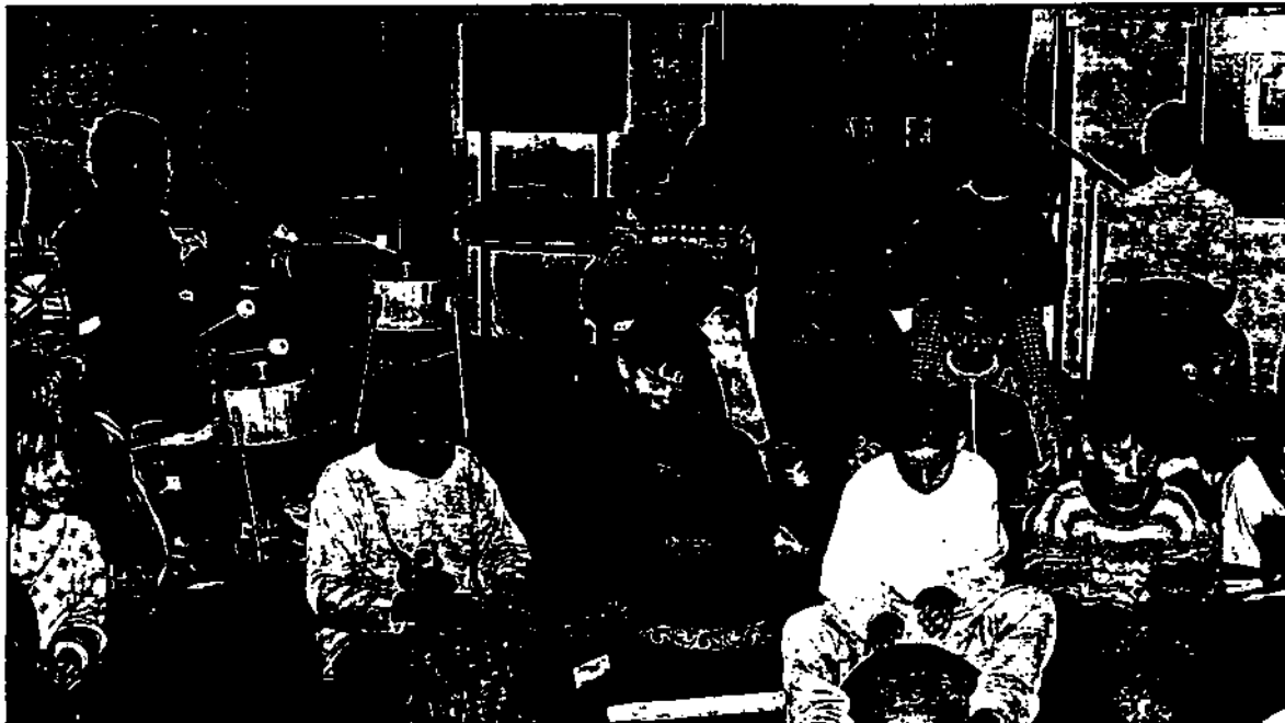
Lundi matin, ultime répétition d'un spectacle conçu par les CM2 A de l'école Jacques-Brel avec des artistes originaires du Niger.