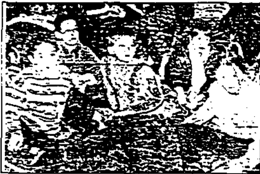
Descendre le fleuve en pirogue en écoutant le chant de la flûte et des percussions, il y a de quoi rêver !

En prélude au voyage musical qui se déroulera ce soir au théâtre, les musiciens nigériens ont été, hier, à la rencontre des jeunes.