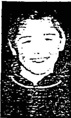
James : « La musique est bonne, et il y a toujours du soleil. Quelle chance ! »

■ A 20 h 30 au théâtre : entrée 80 F ; réservations au 02.39.86.10.10