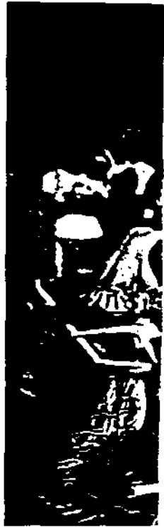
... le long...