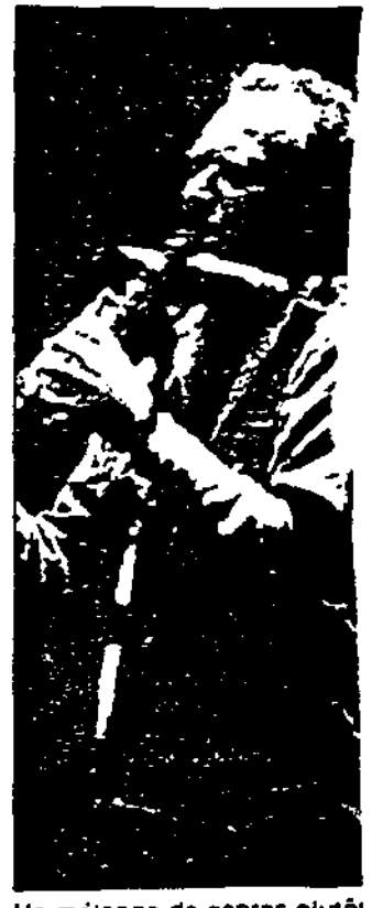
Un mélange de genres plutôt heureux.

sence toute rencontre humaine : elle est un lien de création ». Pour ce concert, le choix de l'improvisation n'a pas été choisi par hasard. A l'image de l'eau servant de lien entre les hommes, elle a desservi la création éphémère de toute une somme de rencontres artistiques issues de sonorités étonnantes de France et du Niger mais aussi du Mali, d'Algérie, du Sénégal et d'Allemagne. L'ensemble confondu de percussions, koutigui, molo, douma ou saxophone.