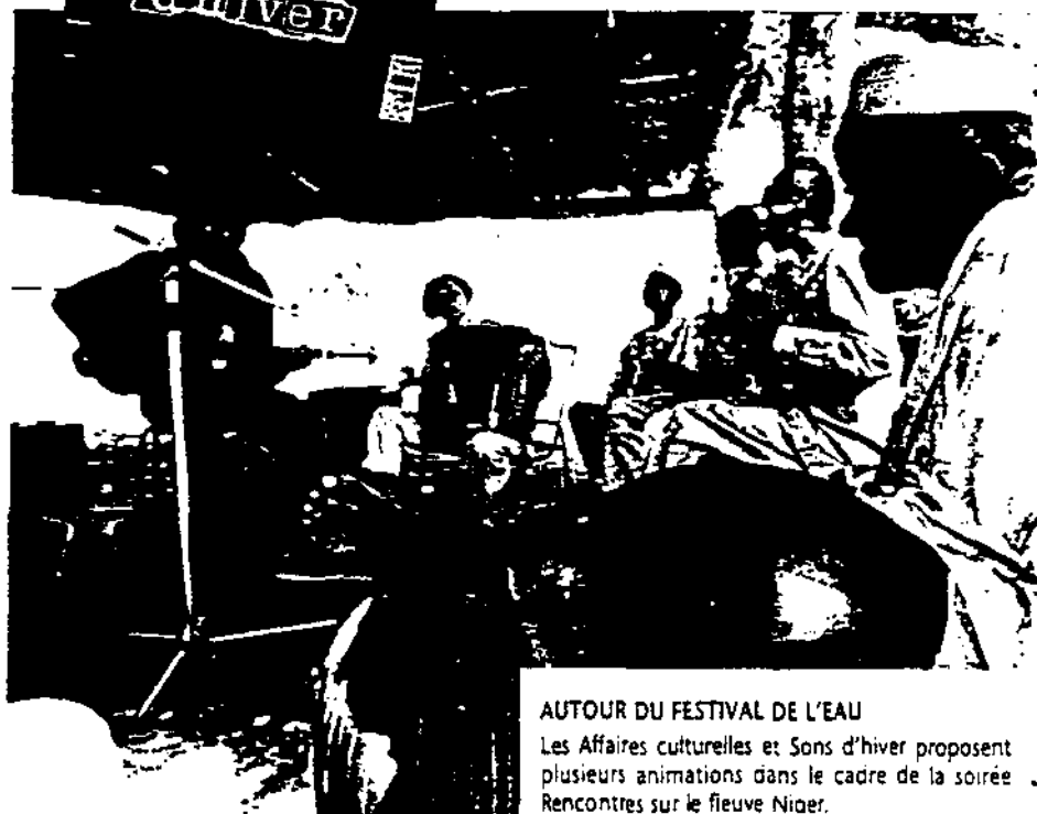
... du fleuve Niger.

fois dans la journée. Lors des coupures fréquentes la dernière maison du quartier à pouvoir tirer de l'eau du robinet était celle de mon père : j'ai