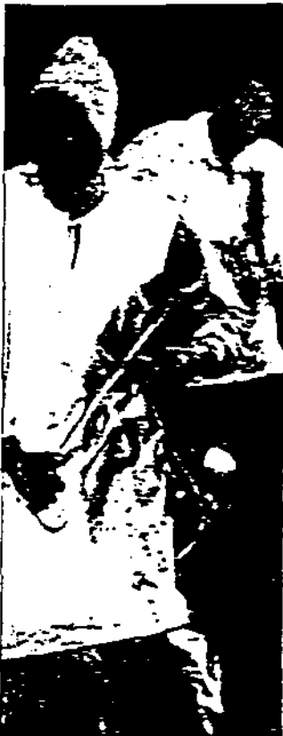
Etonnant spectacle !

L'Afrique toute entière était l'hôte, mercredi, du centre Malraux. A travers une escapade musicale, riche et colorée d'originalité.