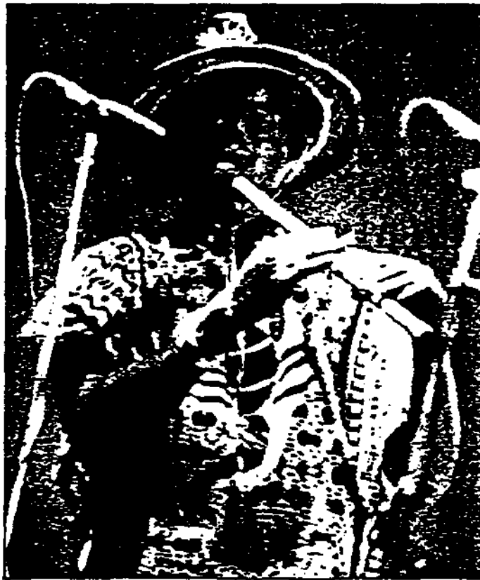
Des musiques chaudes et colorées.

produire pour un unique concert au centre André-Malraux dans le cadre du « Festival de l'eau » élaboré par Camel Zékri.